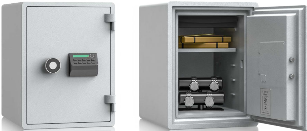
Modell EM 031